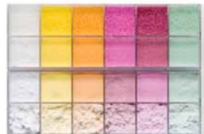
FIGURA 2 - TAMANHO DE PARTÍCULA X INTENSIDADE DE COR NA MESMA DOSAGEM DE CORANTE

tante a se avaliar é a relação entre o tamanho de partícula do produto e do corante. Quanto maior for a relação, maior a eficiência de revestimento. Se o corante for apenas uma grandeza menor do que o produto a ser revestido, então cerca de 50% de corante é necessário para efetuar a cobertura de superfície completa e obter-se uma coloração máxima. Se a diferença de tamanho de partícula é de duas magnitudes, então cerca de 5% de