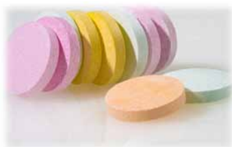
FIGURA 4 - TABLETES COMPRIMIDOS COM CORANTE NATURAL

rencia estas soluções dos corantes naturais padrão já existentes.